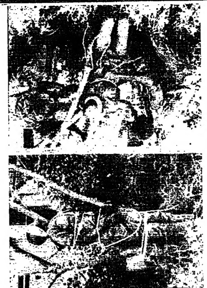
أربع صور مقلقة من فلسطين المحتلة... يجرى في إقليم يافرا المنشق... من أجزاء الإقليم سحب الضباب...